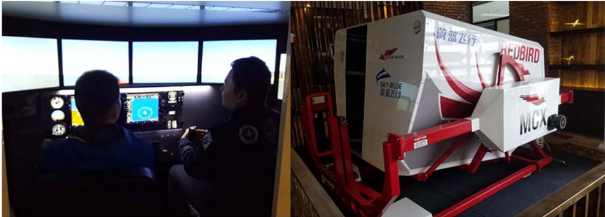
媒体在飞机模拟舱中体验驾驶赛斯纳 172 飞机的乐趣