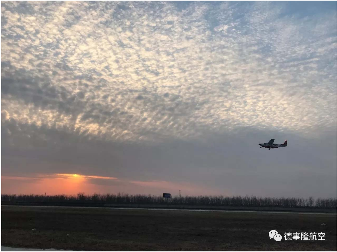
赛斯纳加长型大篷车 208EX 从石家庄栾城机场顺利起飞，启程飞赴越南