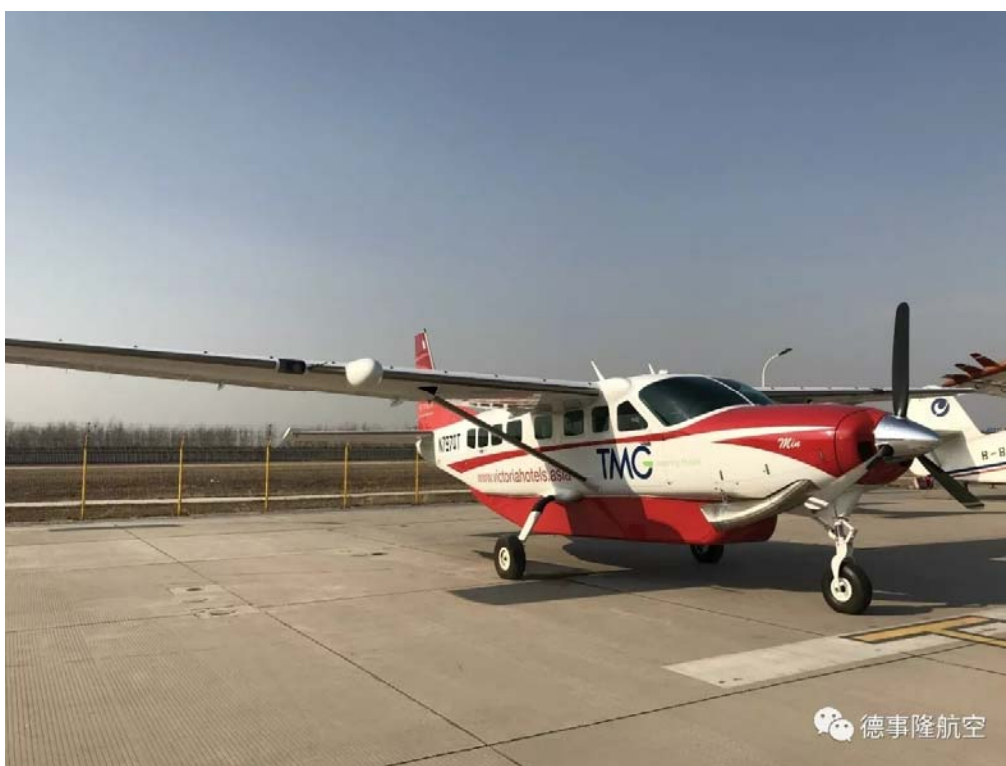
等待交付的赛斯纳加长型大篷车 208EX