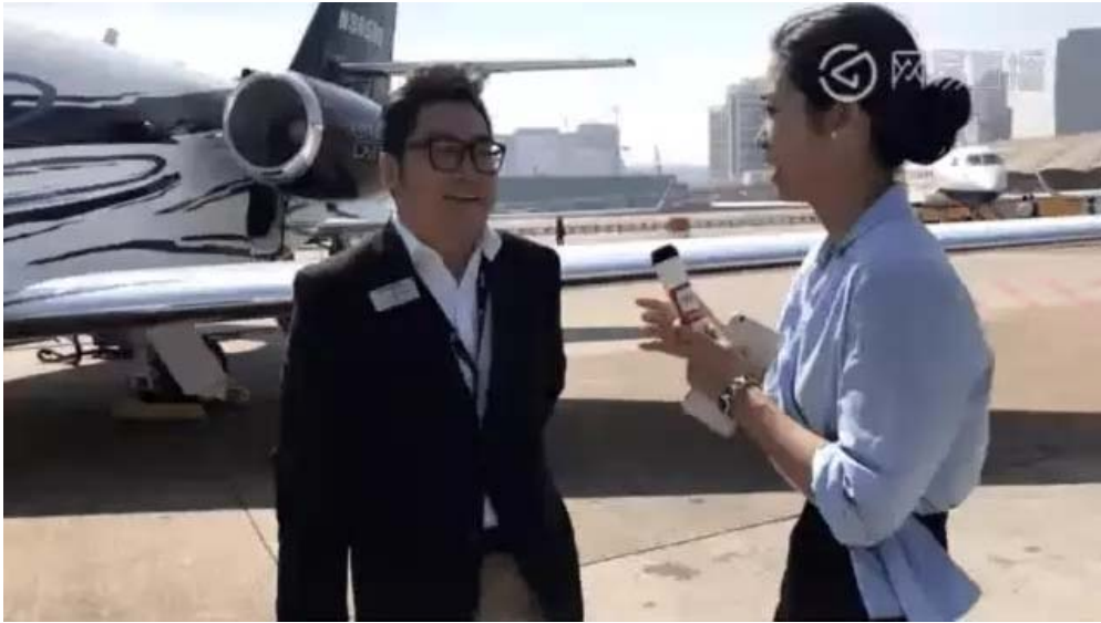
网易直播平台带领网友一睹奖状纬度风采