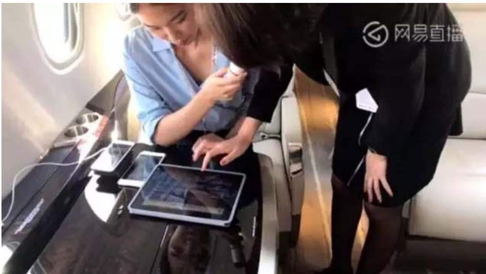
网易主播亲身体验先进机上娱乐系统

11月3日，德事隆航空大中华及蒙古地区国际销售副总裁吴景奎同时受邀出席澳门公务航空发展论坛，并以「粤港澳大湾区，水上飞机发展新高地」为主题发表演讲。