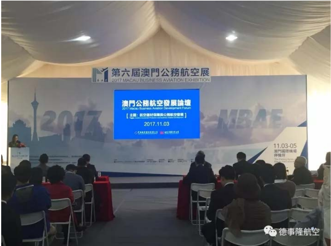
澳门公务航空发展论坛现场