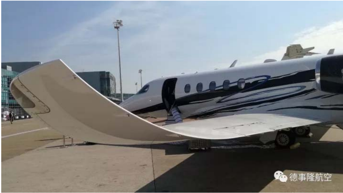
蓝天白云映衬下的奖状纬度，散发无穷魅力