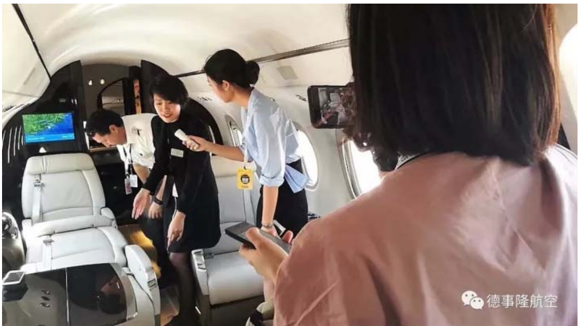
德事隆航空区域销售经理向网易观众展示奖状纬度精致宽敞的客舱设计