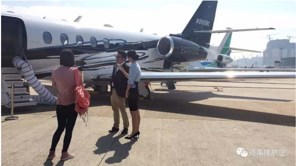
德事隆航空区域销售总监向网易网友介绍畅销全球的奖状纬度