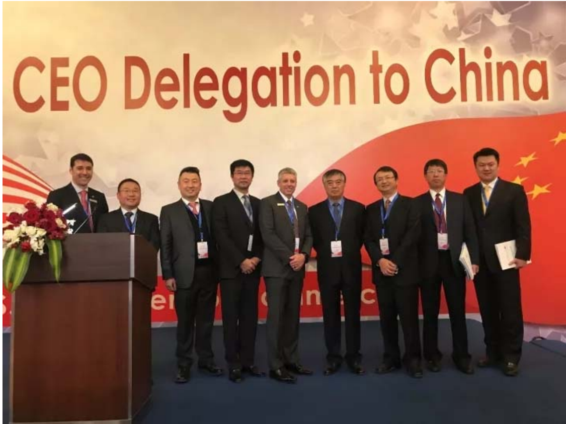
各方代表出席当天晚宴

贝尔直升机公司新设计的 5 座贝尔 505 使用先进的航电技术，配备久经考验的动部件，采用先进的气动设计，搭载一台双通道数字化全权控制的透博梅卡 Arrius 2R 型发动机，使得该型号集卓越性能，安全可靠于一体，是同级别中具备最佳成本效益的直升机。