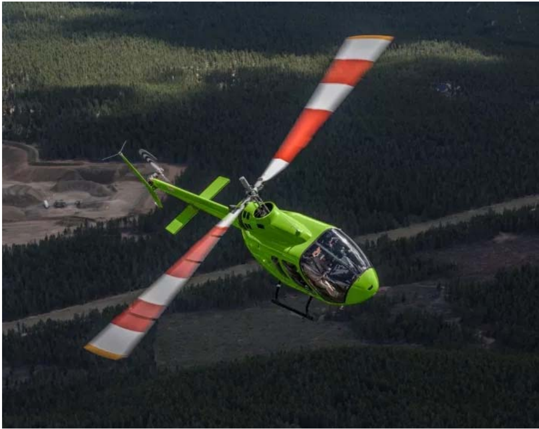
贝尔 505 直升机